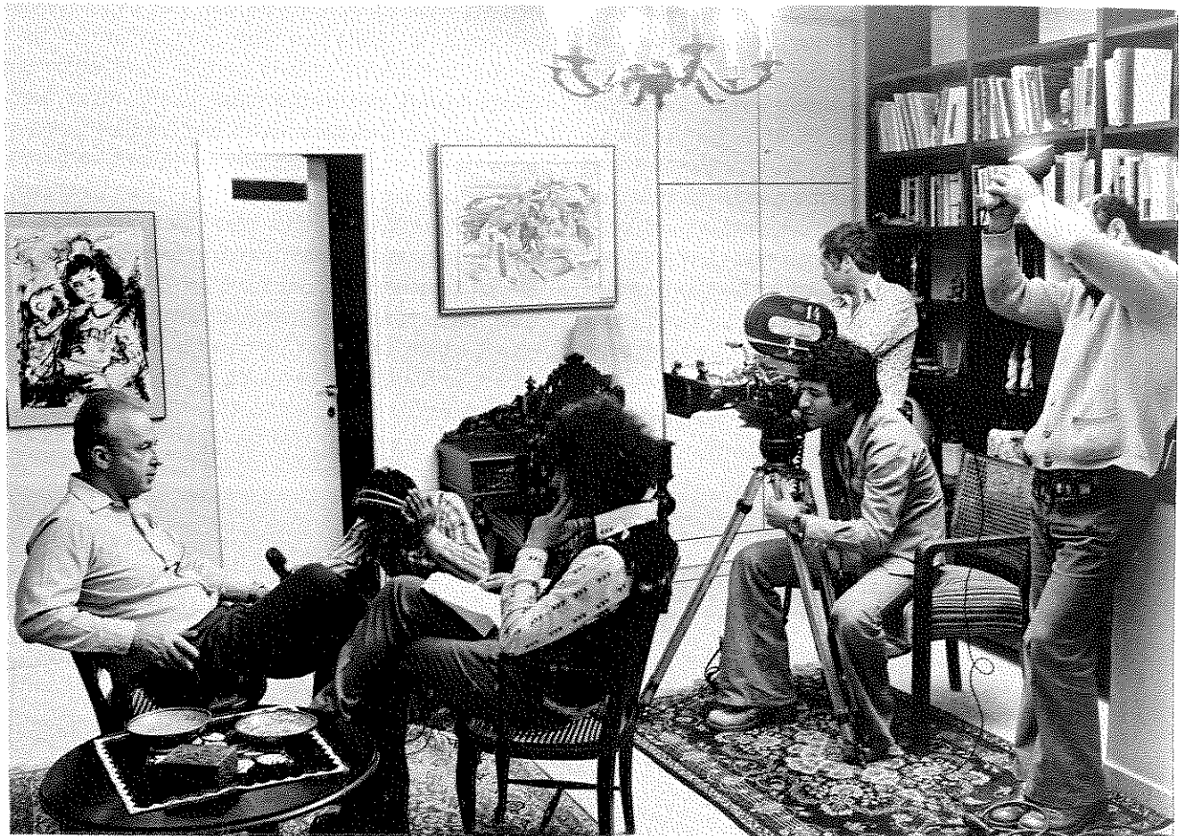
בעת צילום ראיון לטלוויזיה הישראלית בביתו, 1974

חינוכית של שליחותו הדיפלומטית. גם תחנות הטלוויזיה מצידן היו מעוניינות להביא לצופיהן לעתים קרובות "אייטס" על ישראל, ודמותו הזוהרת של רמטכ"ל הניצחון במלחמת ששת הימים האגדית הגבירה את העניין לעשות כן באמצעות השגריר.