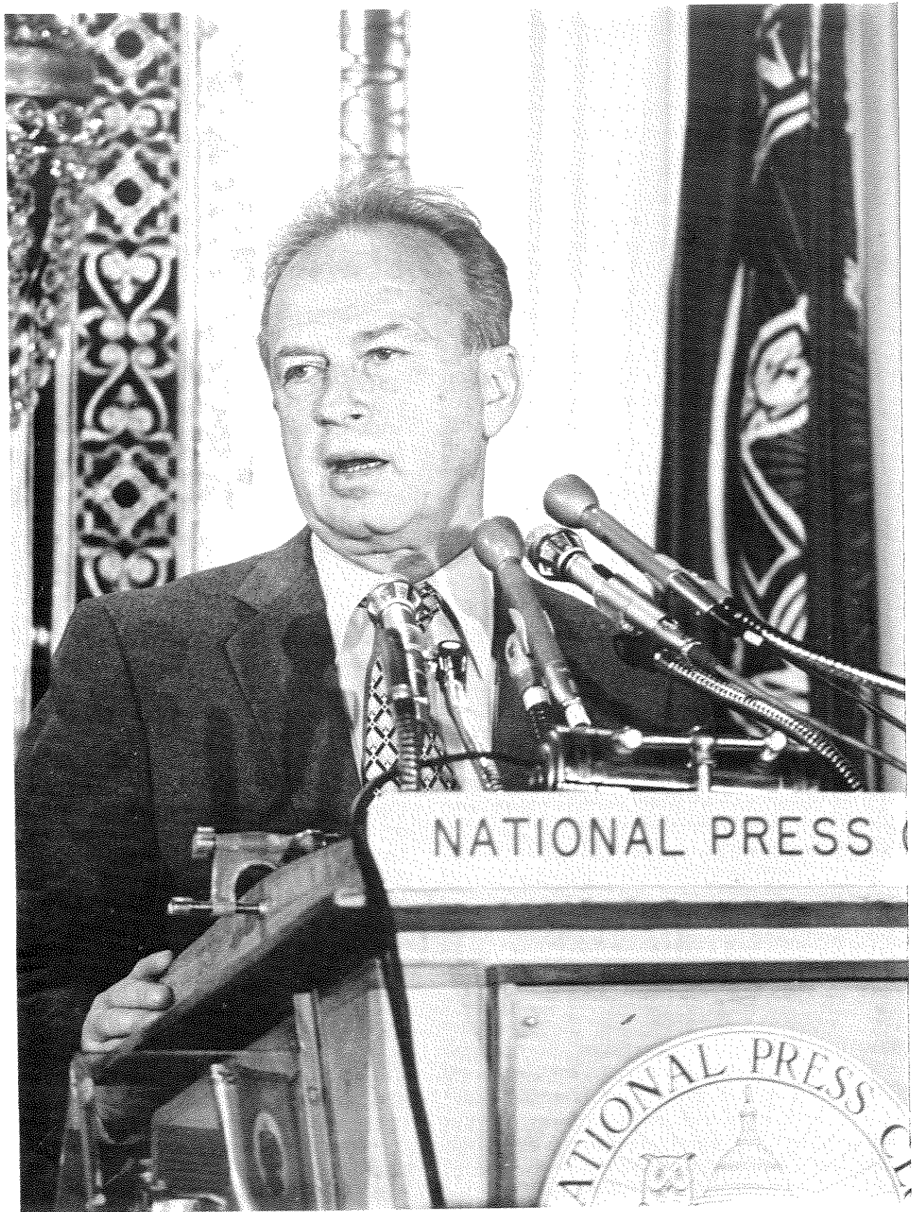
יצחק רבין בווינגטון - במועדון העתונות הלאומי